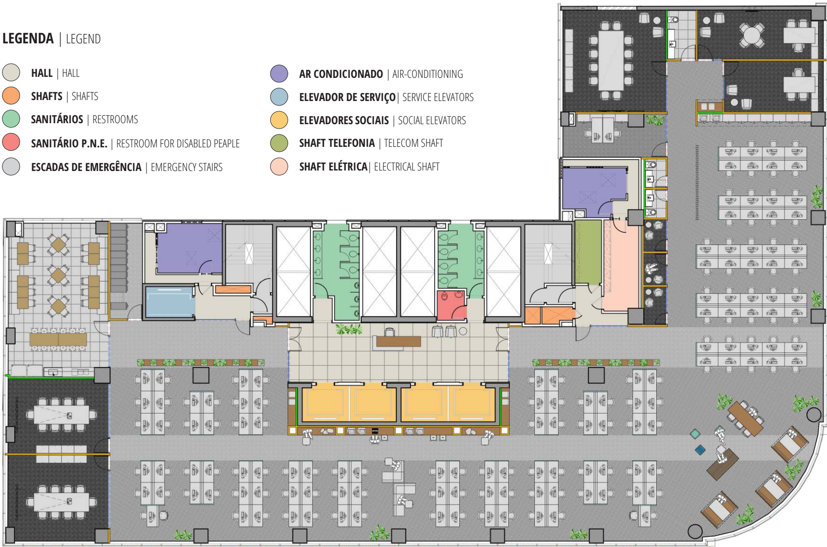
PLANTA DO ANDAR TIPO ZONA BAIXA | TYPICAL FLOOR LOW RISE

0 1 2,5 5 10 ESCALA GRÁFICA | GRAPHIC SCALE