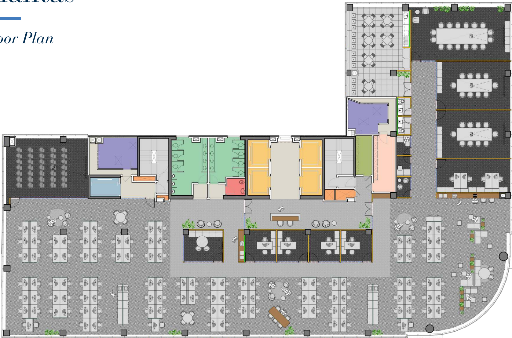
PLANTA DO ANDAR TIPO ZONA ALTA | TYPICAL FLOOR HIGH RISE

0 1 2,5 5 10 ESCALA GRÁFICA | GRAPHIC SCALE